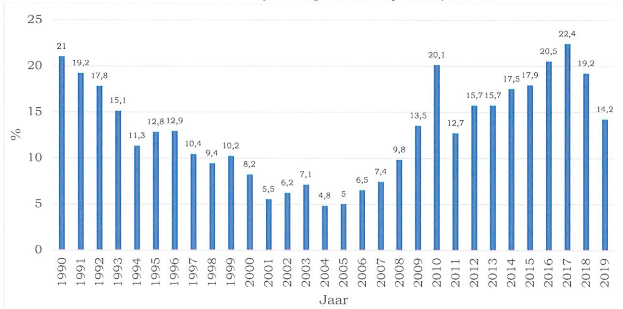
Grafiek 1 Geschatte informele economie als percentage van het bbp 1990 t/m 2019.